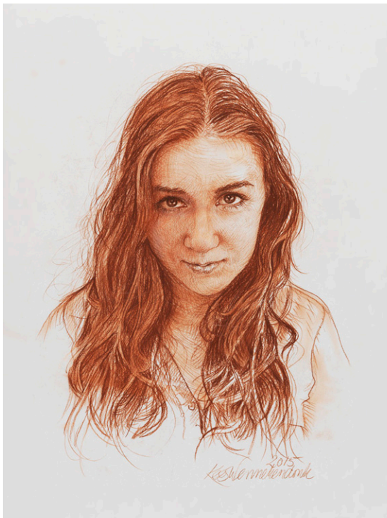
Tekening in rood krijt: 750€ inclusief BTW

Kees Wennekendonk Oudegracht 226W 3511NT Utrecht 0653761632 www.keeswennekendonk.nl @wennekendonk